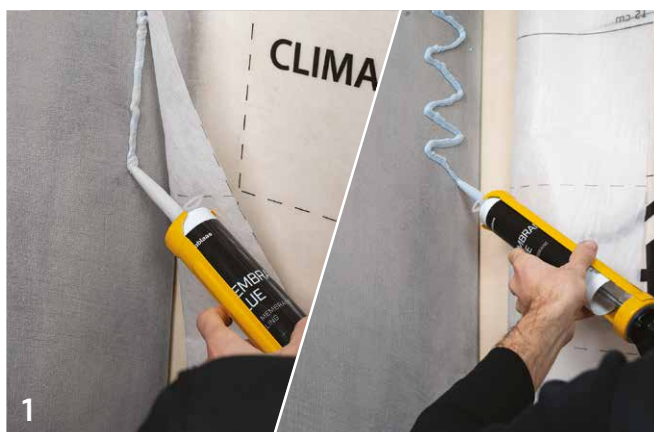
벽과 멤브레인 접합부 - 콘크리트